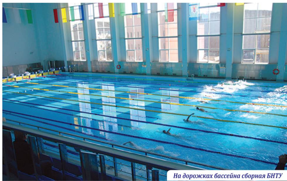
На дорожках бассейна сборная БНТУ

В университете функционируют 36 студенческих сборных команд по 34 видам спорта. БНТУ