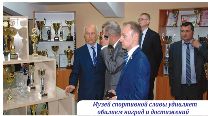
Музей спортивной славы удивляет обилием наград и достижений