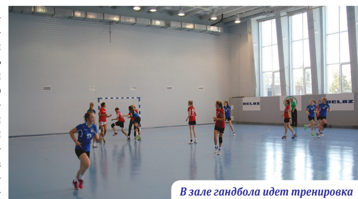
В зале гандбола идет тренировка