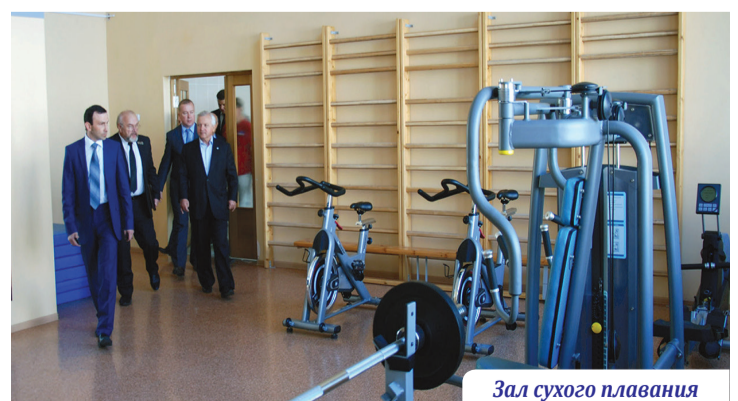
Зал сухого плавания

располагает современной спортивной базой, сегодня это 18 спортивных залов, стадион, лыжная база, спортивные площадки, бассейн. Ежегодно в университете проводится спартакиада среди сборных команд факультетов по 20 видам спорта, регулярно проходят Дни здоровья и соревнования среди студентов, прожи-